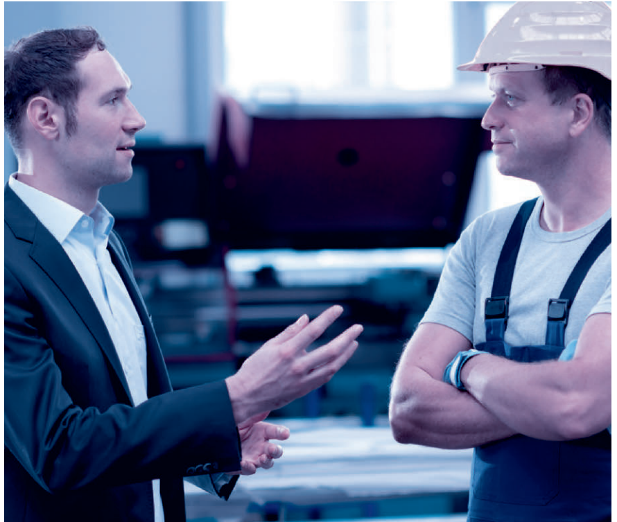
Das Mitarbeitergespräch ist keine Nebensache. Nehmen Sie sich Zeit und hören Sie zu.

Sinnvollerweise wird für das Mitarbeitergespräch zudem ein über die Jahre gleichbleibender Beurteilungsbogen mit einer Bewertungsskala (mit Smileys, Ampeln, Zahlen oder Buchstaben) verwendet.